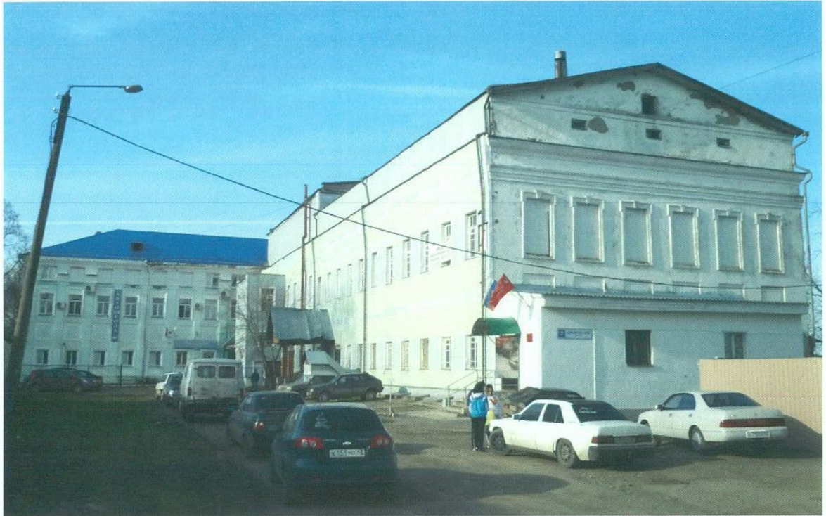
Фото 2. «Архитектурный комплекс: 2 здания присутственных мест», Кировская область, г. Киров, Динамовский проезд, д. 2. Дата – 25.04.2016.