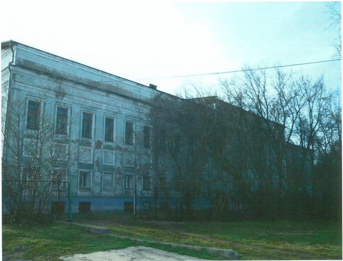
Фото 1. «Архитектурный комплекс: 2 здания присутственных мест», Кировская область, г. Киров, Динамовский проезд, д. 2. Дата – 25.04.2016.