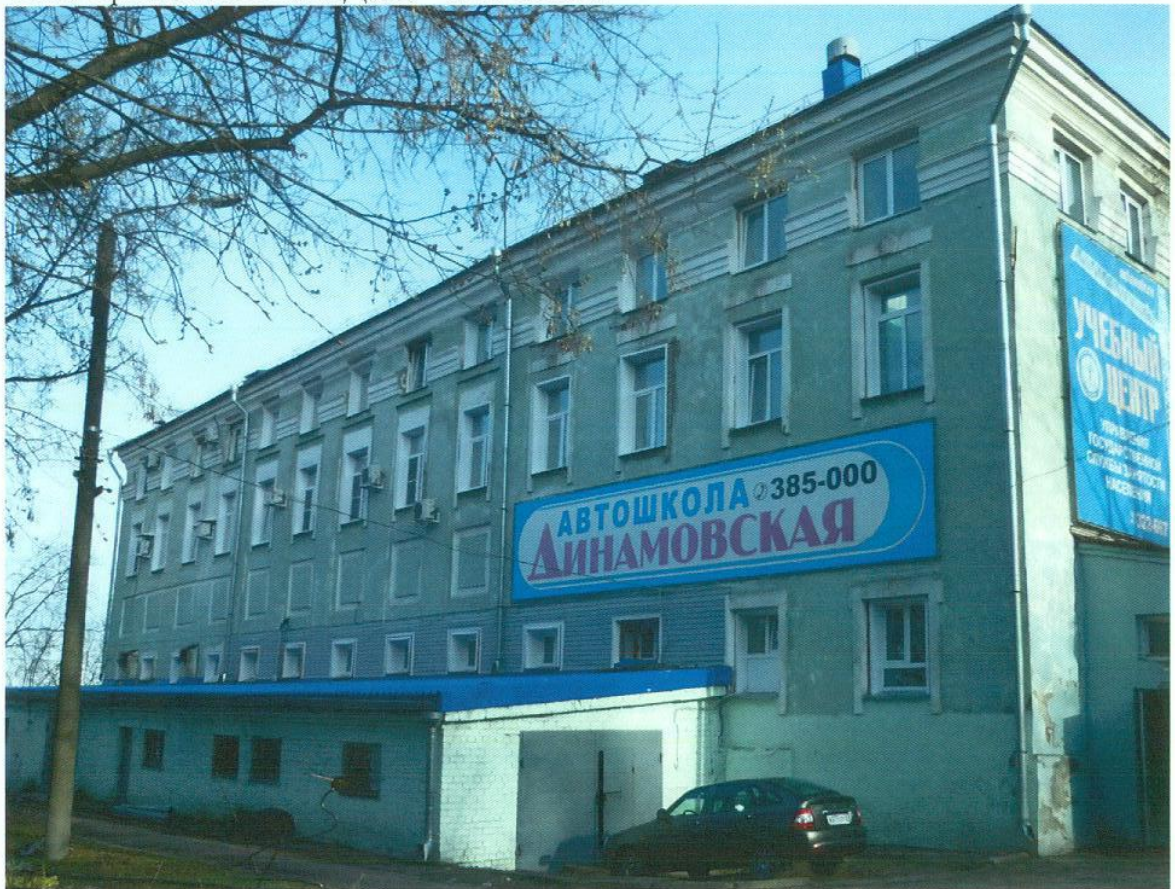
Фото 3. «Архитектурный комплекс: 2 здания присутственных мест», Кировская область, г. Киров, Динамовский проезд, д. 2. Дата – 25.04.2016.